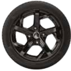
Alufelgen, Reifen 155/60R15, «Seven-Style» schwarz